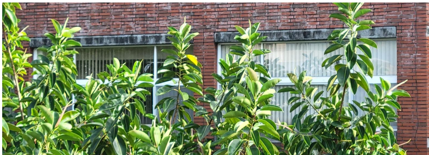
下圖由室外拍攝，明顯可見改善，有霧狀條紋及其他窗簾遮蔽，樹林影像較施作前模糊。