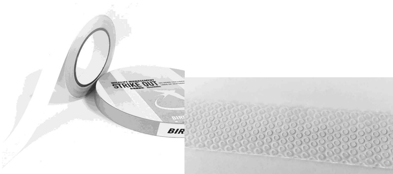
上圖為市售防窗殺窗貼膠帶，透明有凹凸裝霧面。

改善後，本次移除窗戶鏡面窗貼及使用市售防窗殺窗貼膠帶，讓窗戶有明顯霧面帶狀，讓動物容易分辨窗戶存在。並以窗簾遮蔽窗戶做遮陰及更明顯的障礙物，避免動物窗殺。